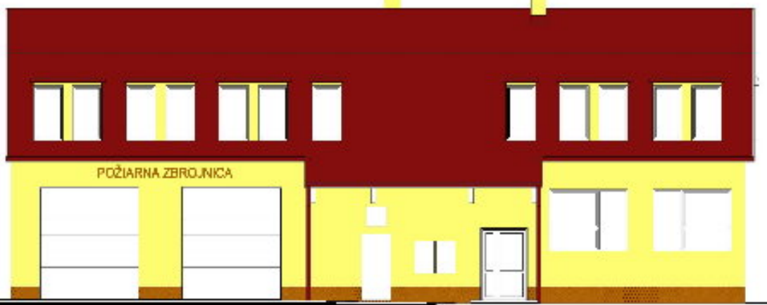
POHĽAD - ČELNÝ